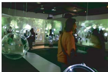
FIAC Luxe!, installation scénographique