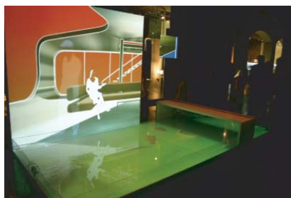
H2o, installation interactive